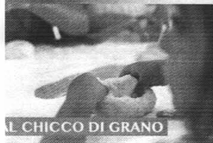
AL CHICCO DI GRANO