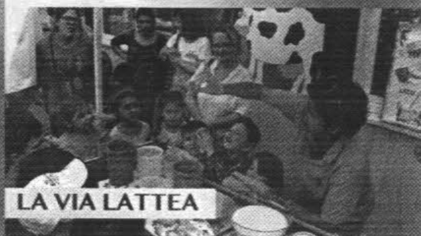
LA VIA LATTEA