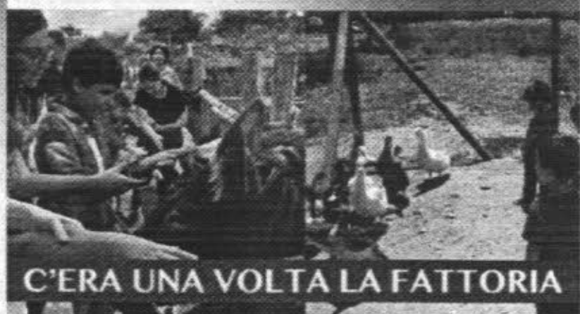
C'ERA UNA VOLTA LA FATTORIA