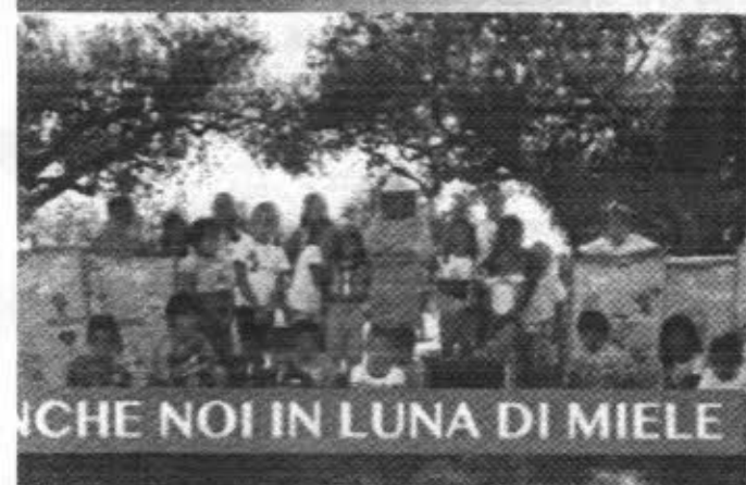
NCHE NOI IN LUNA DI MIELE