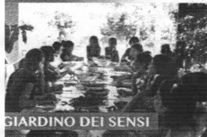
GIARDINO DEI SENSI